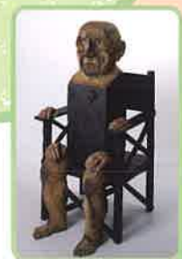
マリソール(ピカソ) 1981年

*駐車場 ●地下駐車場…2時間まで駐車料金無料 ●高岡文化の森駐車場(屋外)…駐車料金無料